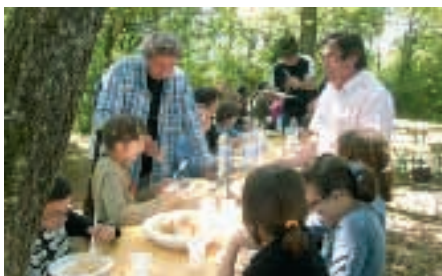
Pique-nique avec les enfants de l'école de Couzon

- la journée pédagogique : Victime de notre succès, cette année, deux classes primaires (CM1 & CM2) ont voulu participer à cette sortie. Le but de cette journée est de valoriser notre espace naturel en faisant découvrir aux enfants le patrimoine local, la flore et la faune qui nous entourent et que nous devons protéger.