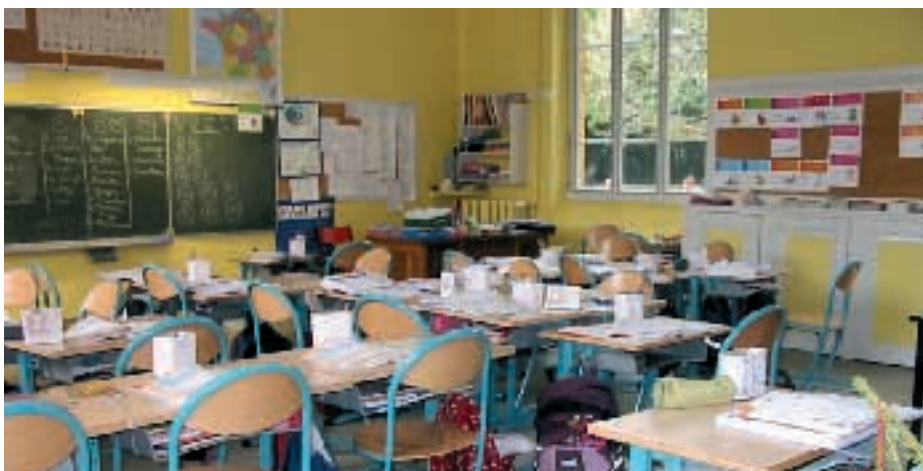
Salle de classe rénovée et nouveaux bureaux

Par ailleurs, après étude et recensement du parc informatique se trouvant dans chacune des classes, l'équipe municipale a souhaité financer une salle informatique composée de 15 ordinateurs. L'outil sera opérationnel à partir de mars 2009.