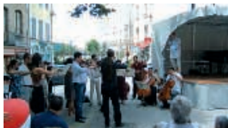
Orchestre de la Camerata du Rhône en concert off Place Ampère

L'été dernier, le festival des Pianissimes s'est déroulé du 29 juin au 7 juillet, en 7 concerts à l'Espace Culturel Jean Vilar et non sur l'Esplanade du Château.