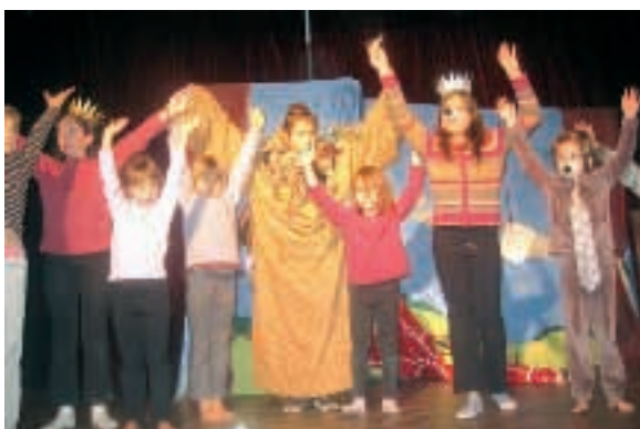
Stage de comédie musicale