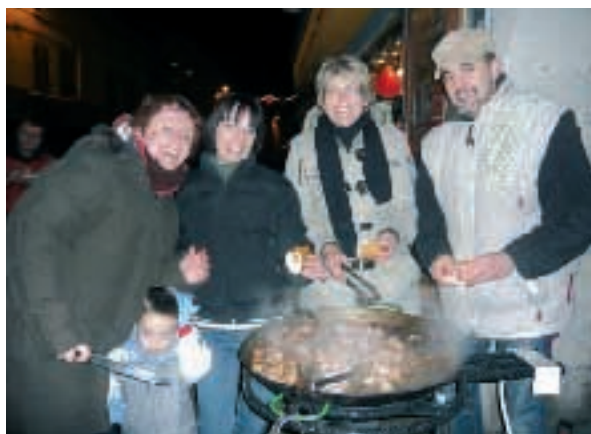
Les commerçants dans les rues de Couzon le 8 décembre 2008

Une réunion avec les commerçants sera organisée au cours du premier trimestre 2009 pour continuer dans ce sens.