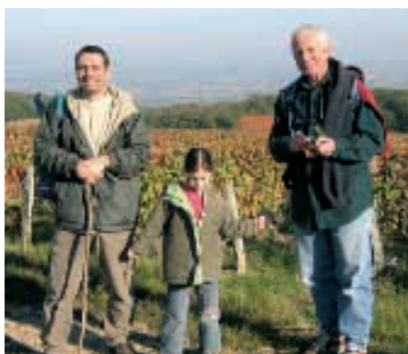
3 générations de marcheurs