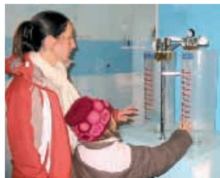
Exposition « la maison économe »