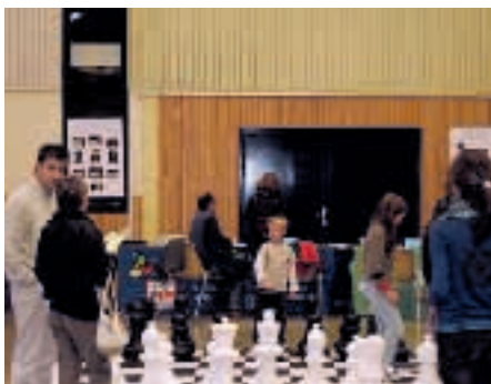
Forum des Associations le 14 septembre 2008

La commission a pris le temps dès le début du mandat d'écouter les associations et les jeunes pour recueillir leurs attentes. Des rencontres régulières sont organisées pour faciliter les échanges ; des informations dans les boîtes aux lettres permettent de vous informer des manifestations. De nombreux petits travaux demandés par les associations ont été réalisés en 2008 ; ils se poursuivront en 2009.